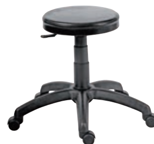
Typ: 4882 ▲