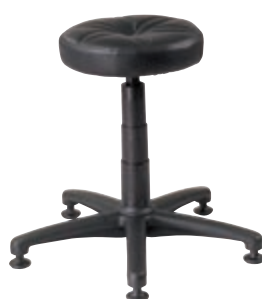
Typ: 4550 ▲