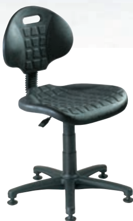
Polyuretánová s klzákami ▲