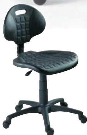
Polyuretánová s kolieskami ▲