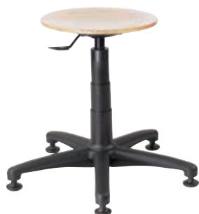
Typ: 4554 ▲