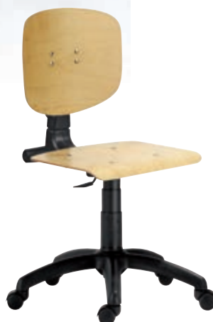
Stolička s operadlom ▲