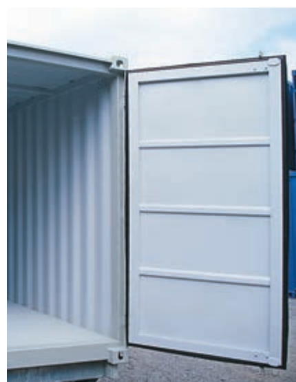
Uhol otvárania 270°.