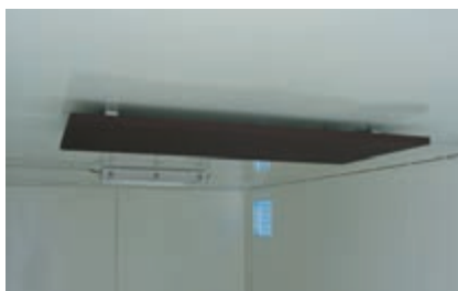
Príklad použitia kúrenia.