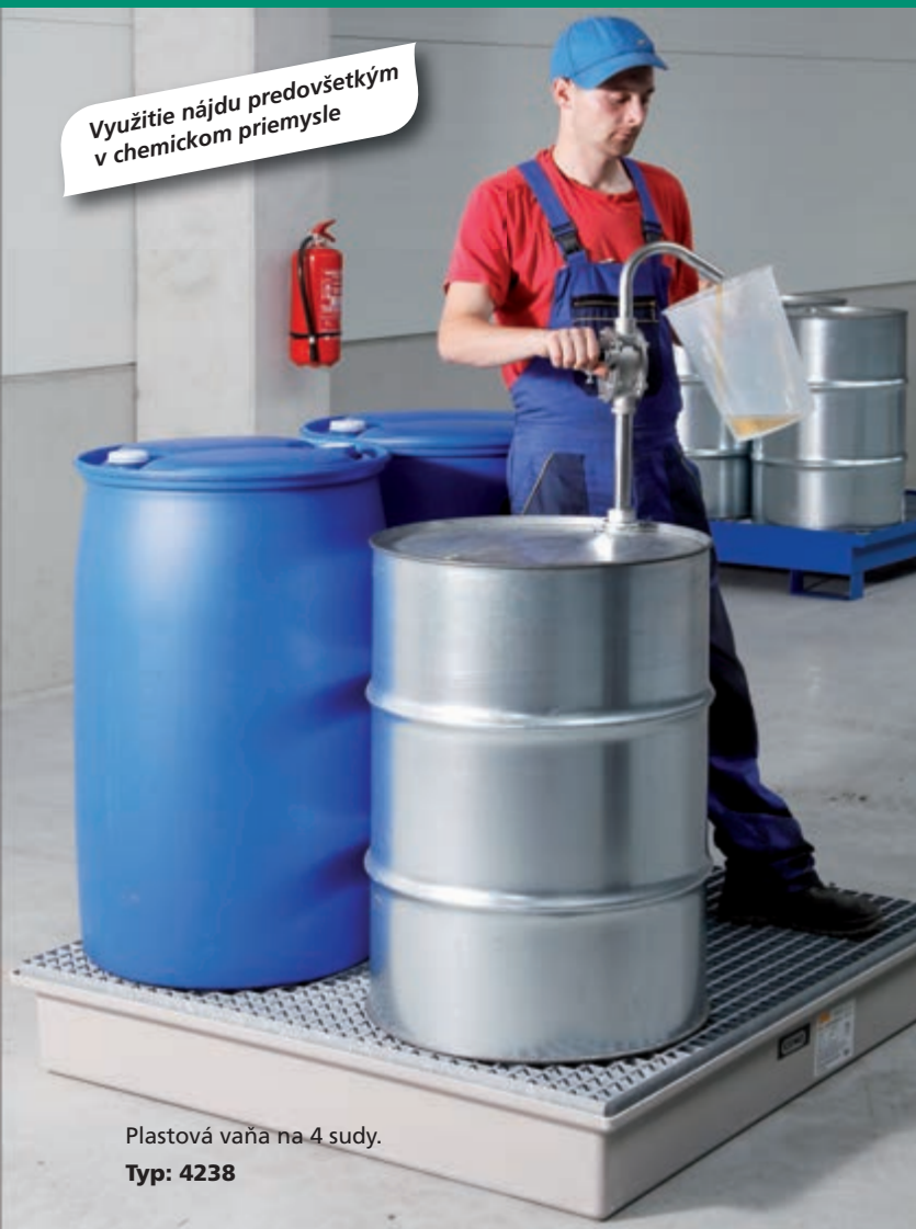
Plastová vaňa na 4 sudy. Typ: 4238

Využitie nájdú predovšetkým v chemickom priemysle