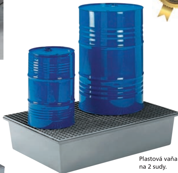
Plastová vaňa na 2 sudy. Typ: 4237