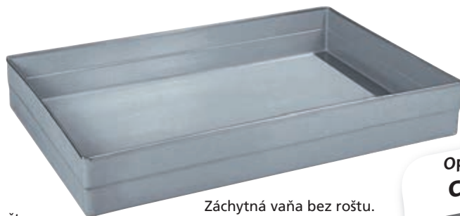
Záchytná vaňa bez roštu. Typ: 4498