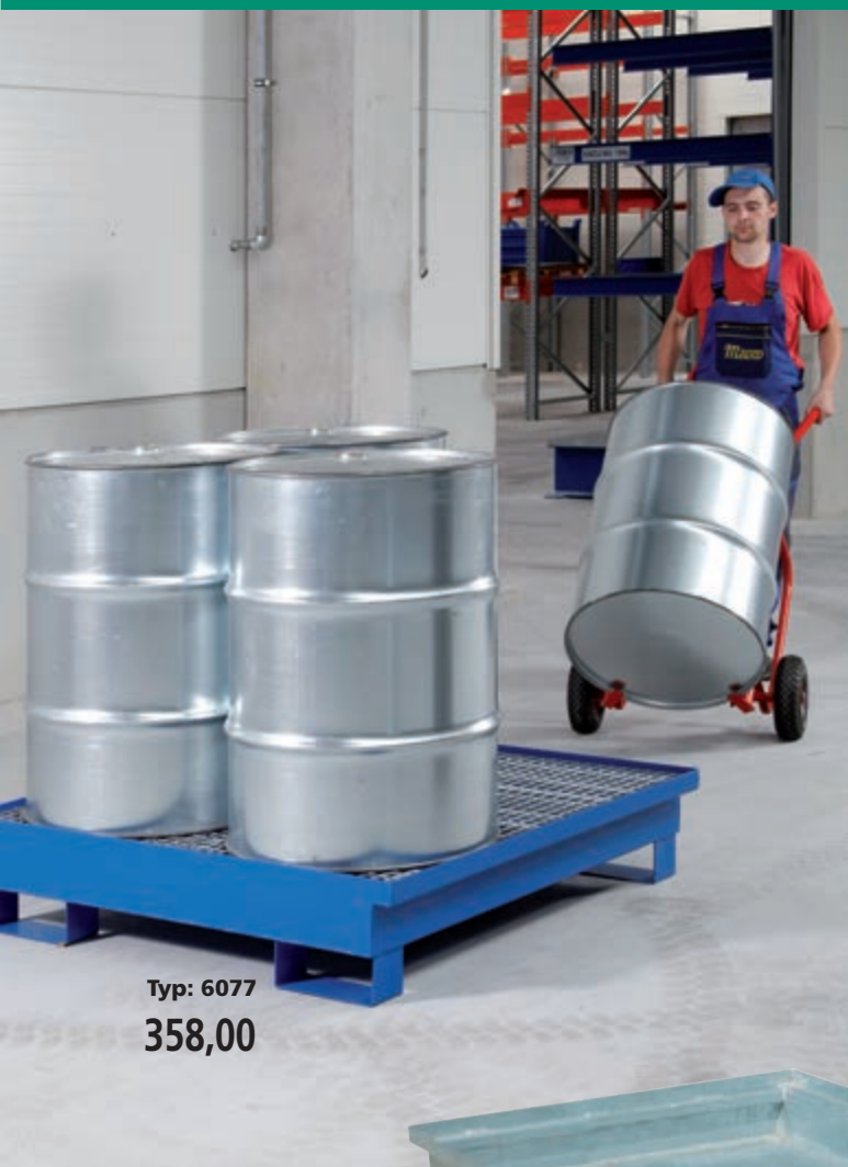
Typ: 6077 358,00