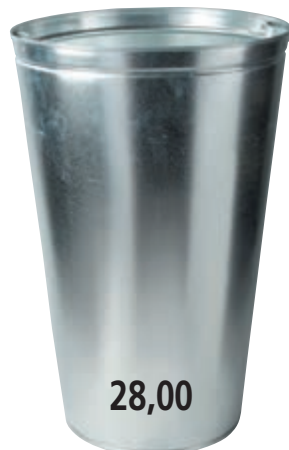
Typ: 6117-B (Pozink. vložka)