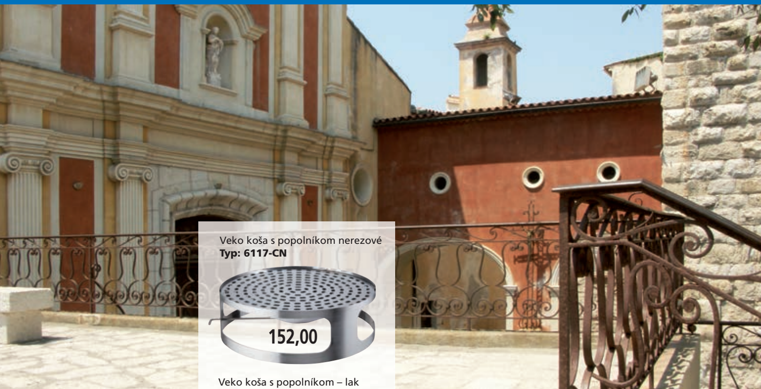
Veko koša s popolníkom nerezové Typ: 6117-CN