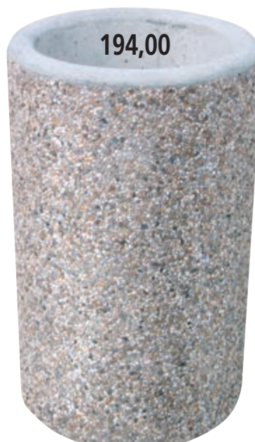
Typ: 3081-A (Pozink. vložka)