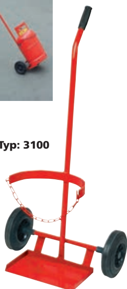
Kółka do pojemnika