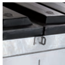
Modyfikacja dla zamka pokrywy