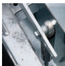
Blokada pokrywy w pozycji otwartej – amortyzator