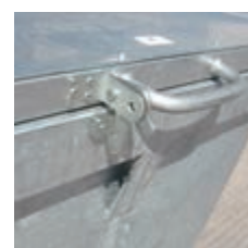
Szczegół zamka – bez sprężyny