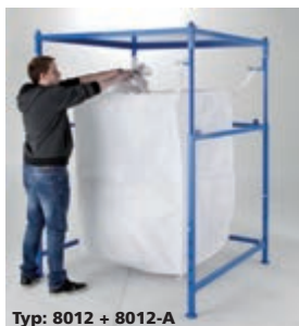
Typ: 8012 + 8012-A