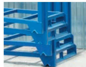
Przykład składania komórek.

Komórka dla jednej EURO palety 120 x 80 cm - ustawiona na szerokość