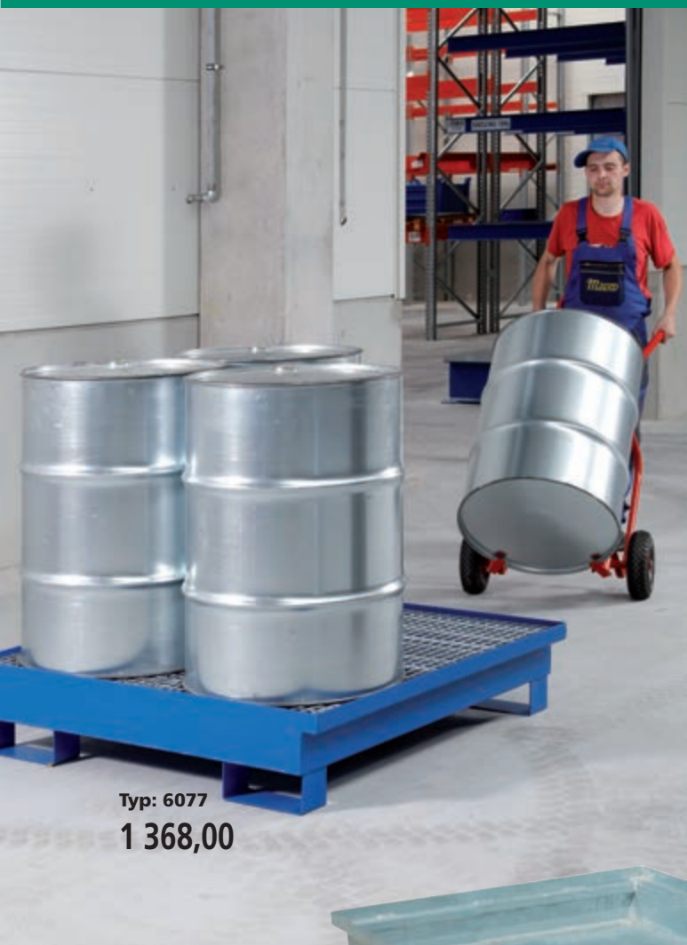
Typ: 6077 1 368,00

Zgodnie z normą EN testowano w zakresie szczelności