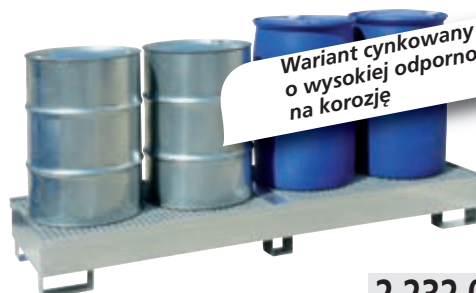
Typ: 6076-Z 2 232,00

Wariant cynkowany o wysokiej odporności na korozję