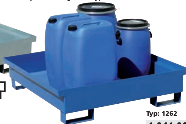
Typ: 1262 1 041,00

Zgodnie z normą EN testowano w zakresie szczelności