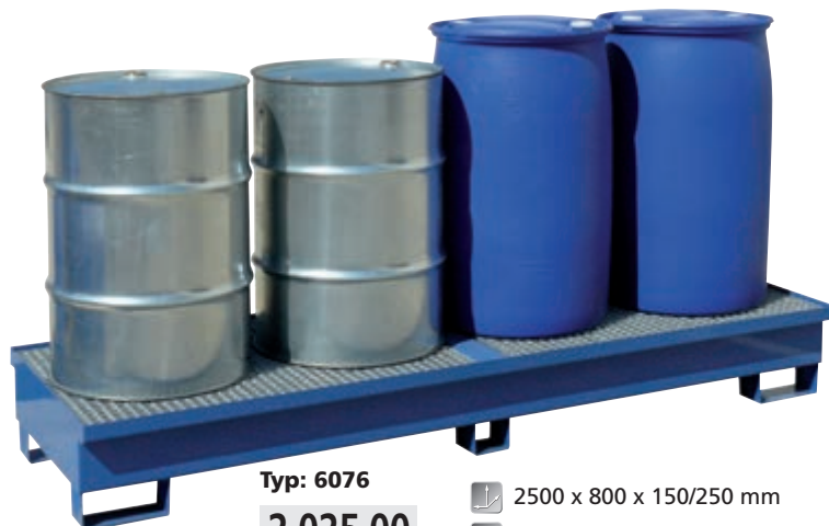
Typ: 6076 2 025,00