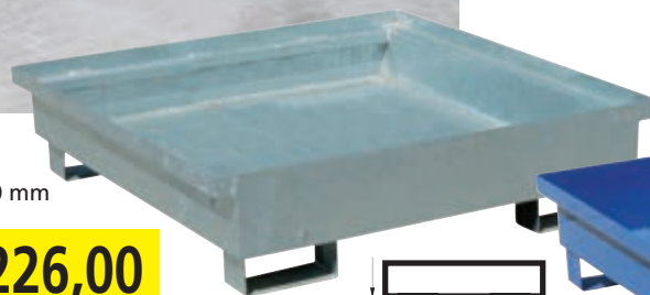
Typ: 1262-Z 1200 x 1200 x 160/260 mm 220 l