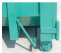
Drugie zabezpieczenie drzwi.