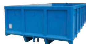
- Wariant do TATRY z dolnym grzebieniem.