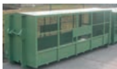
- Wariant siatkowy z dachem.