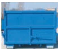
Kłapa, zawiasy na górze + śruby.

- Kontenery są wykonane z zamkniętych profili 100 x 60 mm, pokrycie ścian z blachy 3 mm, dno z blachy 5 mm. Kontenery mogą być wyposażone w otwieraną tylną kłapę lub dwuskrzydłowe drzwi z mechanizmem zamykania. Wykorzystuje się do wywozu sypkich i stałych odpadów. Powierzchnia jest standardowo pokryta jedną warstwą farby podkładowej i farbą nawierzchniową. Na życzenie klienta dostarczamy kontener w innych rozmiarach i wykonaniu.