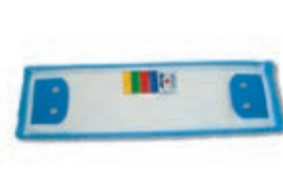
Mop 2 300,- 4768 típus