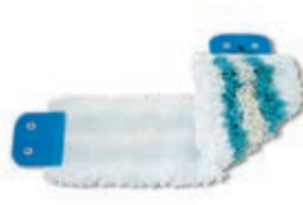
Mop 2 100,- 4767 típus