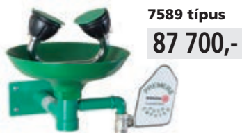
7589 típus 87 700,-