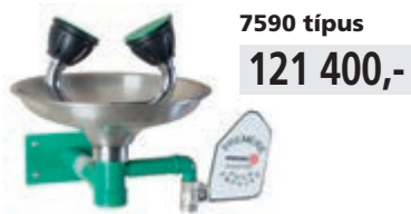
7590 típus 121 400,-