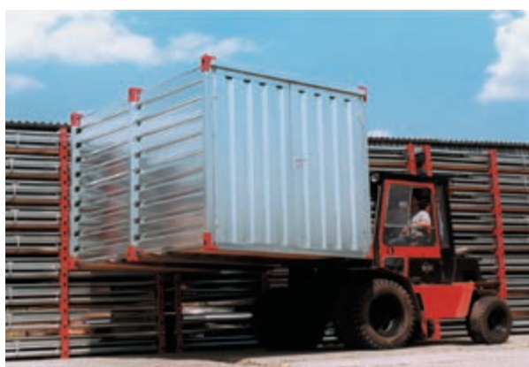
Mozgatható daruva vagy targoncával.