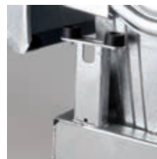
Fedél megállító gumi