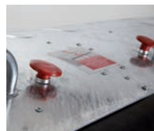
Gyerekzár - szabvány EN 840-6