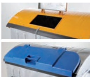
Fedél a fedélben kivételű tető - alternatíva fém / műanyag