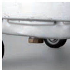
Olaj Cseppenés gátló leeresztő dugó