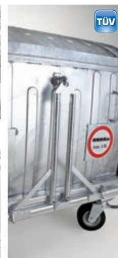
TÜV engedélyezett vonórúd