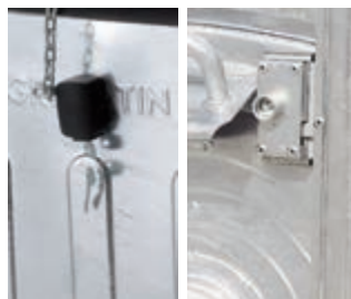
Láncos vagy háromszögű fedélzár