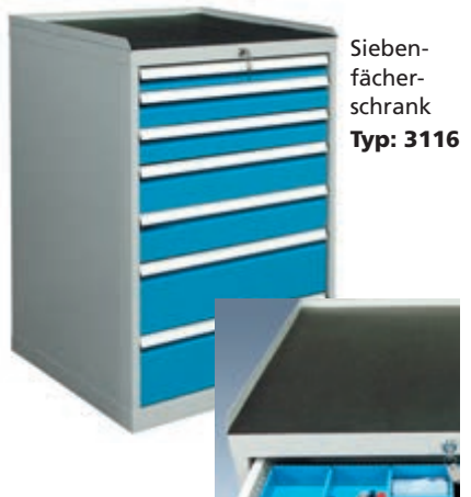
Sieben-fächer-schrank Typ: 3116