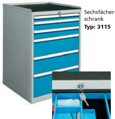
Sechsfächer-schrank Typ: 3115