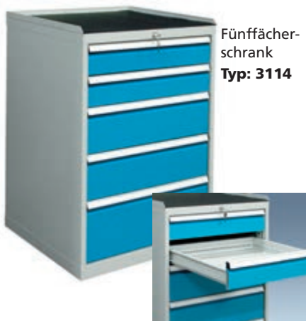
Fünffächer-schrank Typ: 3114