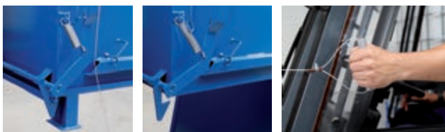
Der Kippmechanismus wird vom Fahrersitz bedient.