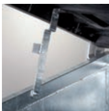
Verriegelung des Deckels in offener Lage