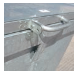
Detail des Schlusses – mit Schwerkraft