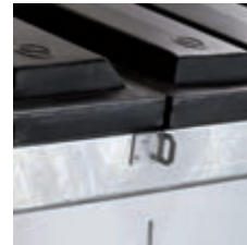
Anpassung für das Deckelschloss