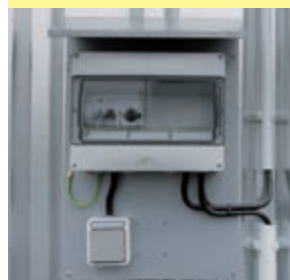
Typ: 7645 Sicherungskasten IP54

Im Falle gleich welchen elektrischen Zubehörs muss ein Sicherungskasten Typ: 7645 bestellt werden.