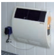
Typ: 7638 Heizungskonvektor 2 kW mit Thermostat