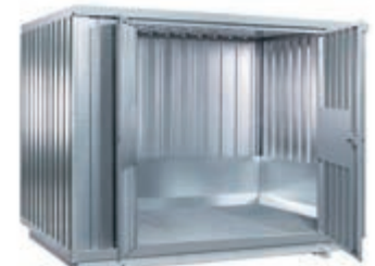
Typ: 7644 zweiflügelige Tür zu den Lagern 7632, 7633 und 7634