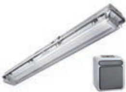
Typ: 7636 Beleuchtung mit Schalter 2 x 58 W