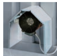
Typ: 7642 Technische Ventilation