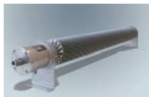
Typ: 7640 Heizung EX 800 W mit Thermostat