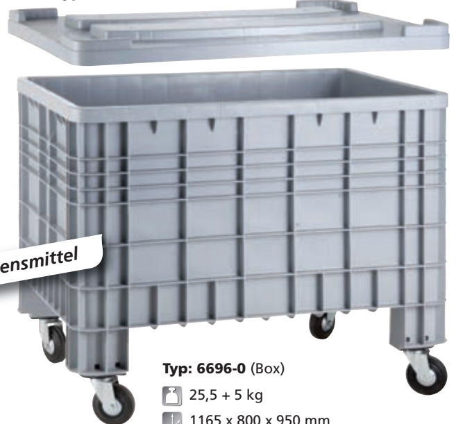
Typ: 6696-0 (Box)