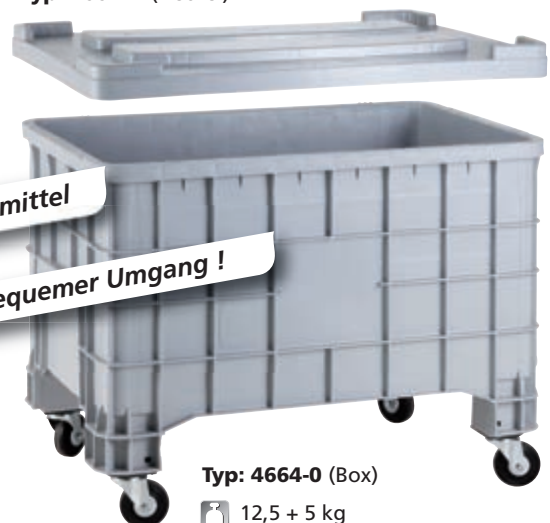
Typ: 4664-0 (Box)