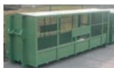
- Netzausführung mit Satteldach.