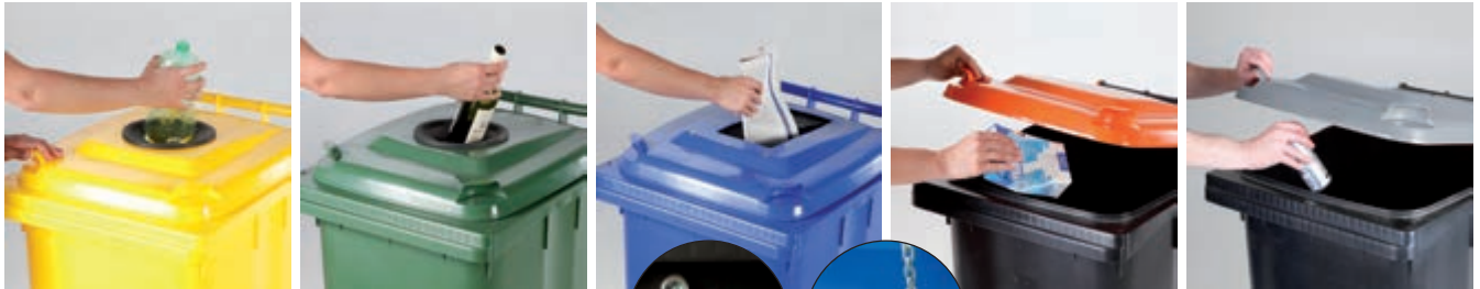
Typ: 0004-3/8 (120 l)

Deckel zur Abfallseparierung PET, Glas, Papier – kann gegen Aufpreis mit einem Schloss nachgerüstet werden.