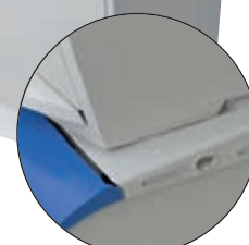
- Vertikální spojení nádob