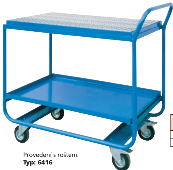
Provedení s roštěm. Typ: 6416