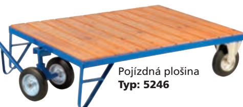
Pojízdná plošina Typ: 5246