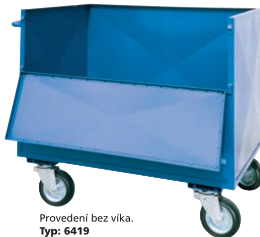
Provedení bez víka. Typ: 6419