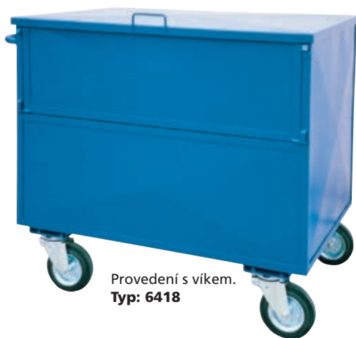
Provedení s víkem. Typ: 6418