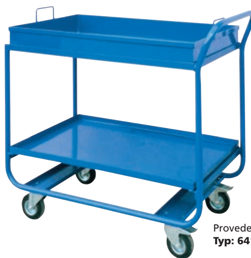
Provedení bez roštu. Typ: 6417