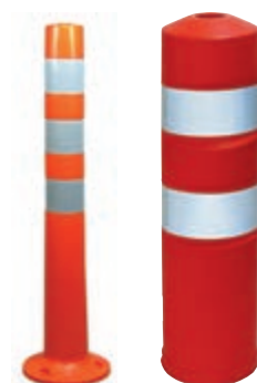
Typ: 7224 Typ: 7225