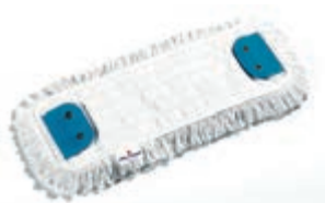
Mop Typ: 6757

- 70 % polyester, 30 % vlna. - Vlákna mopy po celém obvodu.