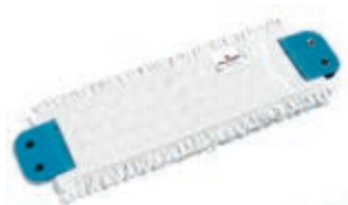
Mop Typ: 4766

Doporučeno do max. teploty 90 °C s využitím standardních čistících prostředků na textilie. Nepoužívat s kyselinou a chlorem.