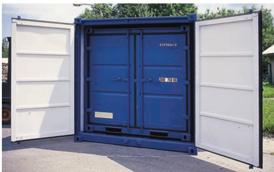
Úspora místa při transportu, možnost vložení kontejneru 9 m 3 do kontejneru 10 m 3 .