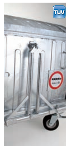
TÜV – certifikovaná oj