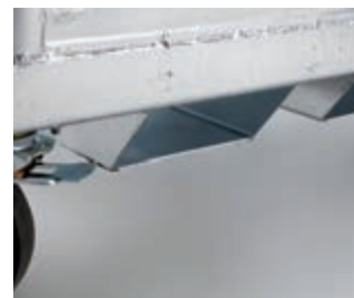
Adaptér na VZV