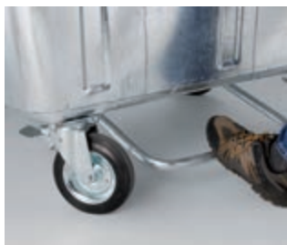
Nožní otevirání víka