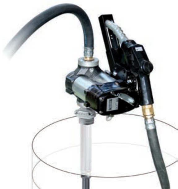
Provedení 230 V s výdejní pistolí s automatickým vypínáním