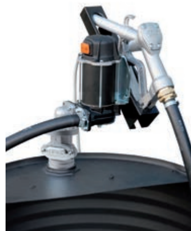
Provedení 12 V s výdejní pistolí