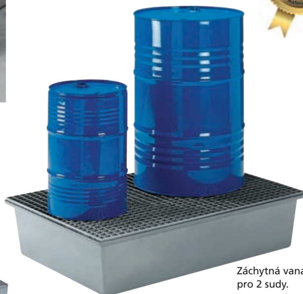
Záchytná vana pro 2 sudy. Typ: 4237