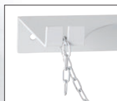
Detail reťaze slúžiacej na upevnenie fľaš.