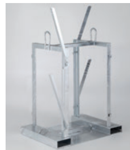
Jednoduchý princíp zabezpečenia fľaš.