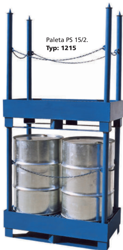
Paleta PS 15/2. Typ: 1215