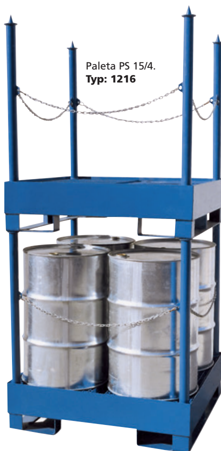
Paleta PS 15/4. Typ: 1216