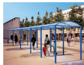
Zastosowany wariant – kryte przejście.