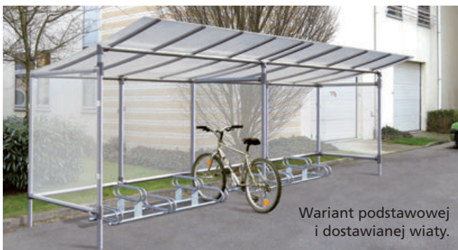
Wariant podstawowej i dostawianej wiatki.