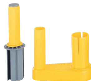
Uchwyt plastikowy Typ: 0064