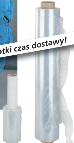
Folia Typ: 0063