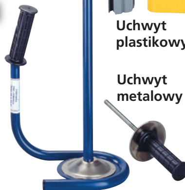
Uchwyt metalowy Typ: 0065