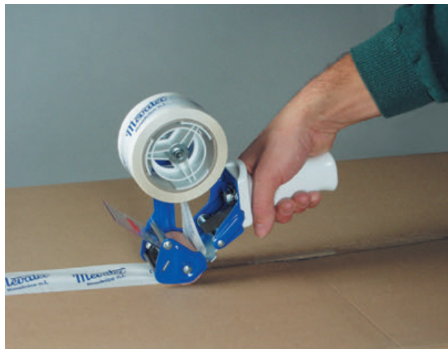
Typ: 6517 Owijarka taśmy klejącej 50 mm.