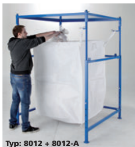
Typ: 8012 + 8012-A