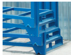
Przykład składania komórek.

Komórka dla jednej EURO palety 120 x 80 cm - ustawiona na szerokość