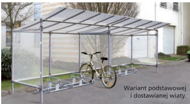
Wariant podstawowej i dostawianej wiatki.