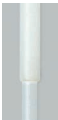
Szczegóły rurki teleskopowej.