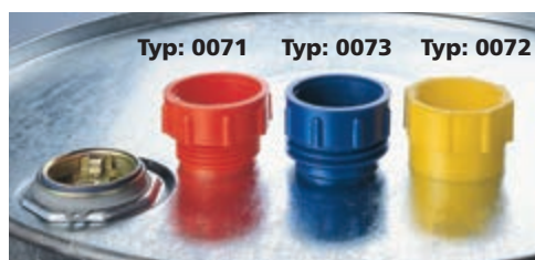
Typ: 0071 Typ: 0073 Typ: 0072