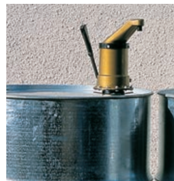
Pompa ręczna przykręcona do beczki.