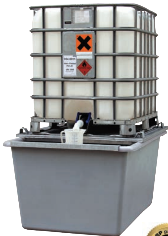
Laminatowa wanna 1000 l. Typ: 4239