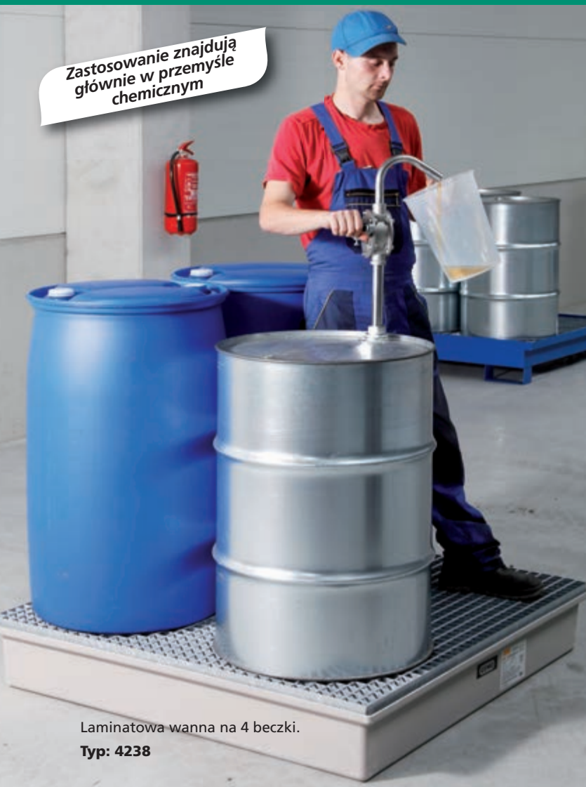
Laminatowa wanna na 4 beczki. Typ: 4238

Zastosowanie znajdują głównie w przemyśle chemicznym