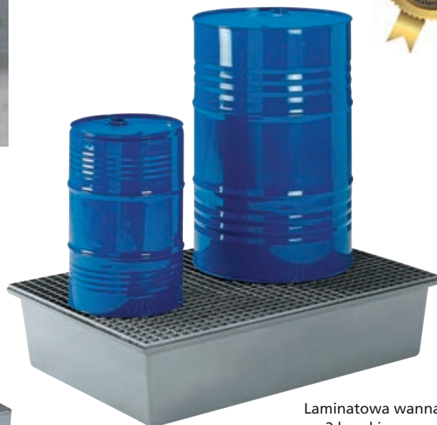
Laminatowa wanna na 2 beczki. Typ: 4237