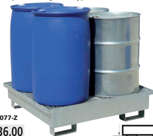
Typ: 6077-Z 1 236,00