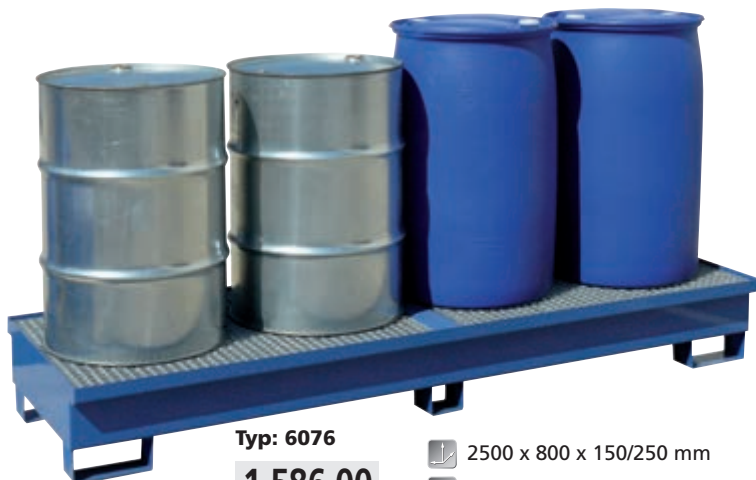
Typ: 6076 1 586,00