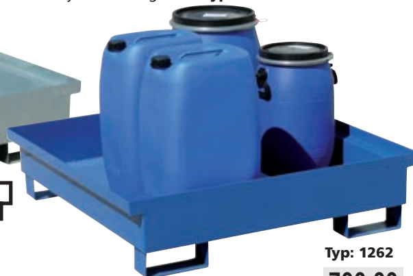
Typ: 1262 700,00

Zgodnie z normą EN testowano w zakresie szczelności