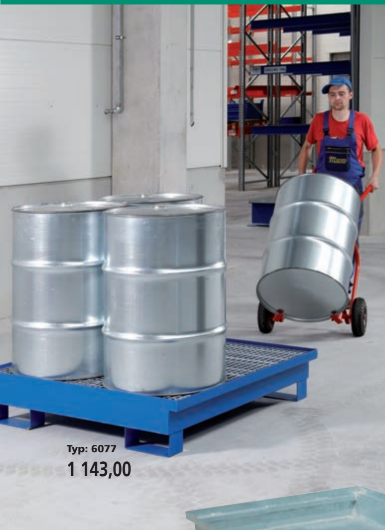
Typ: 6077 1 143,00

Zgodnie z normą EN testowano w zakresie szczelności