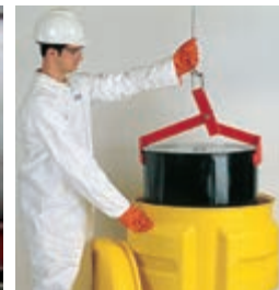
4 warianty użycia