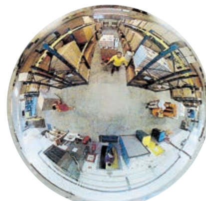
4 irány ellenőrzése