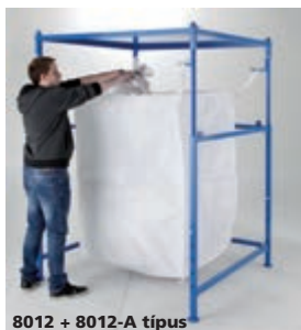
8012 + 8012-A típus