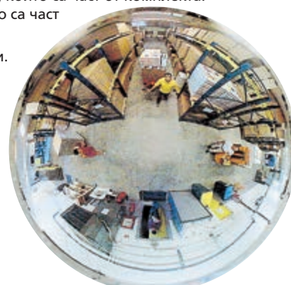
Контрол в 4 посоки