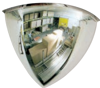
Контрол в 2 посоки