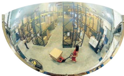
Контрол в 3 посоки