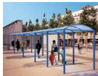
Вариант за външна употреба-закрит проход