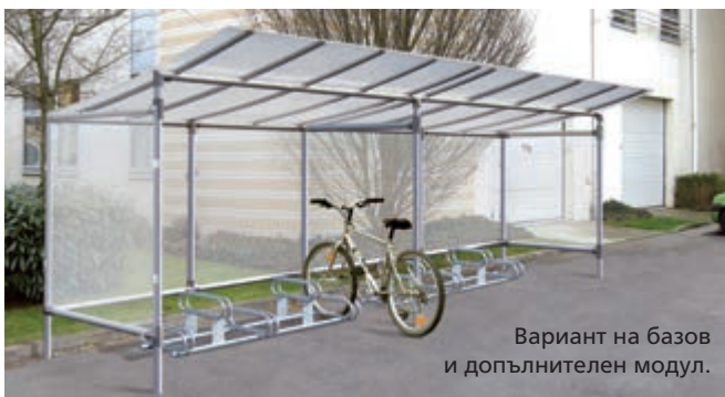
Вариант на базов и допълнителен модул.