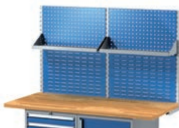
Тип: 7678 609,25 лв (без ДДС) / с ддс: 731,10 1500 x 150 x 880 мм