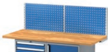
Тип: 7677 247,00 лв (без ДДС) / с ддс: 296,40 1500 x 150 x 444 мм