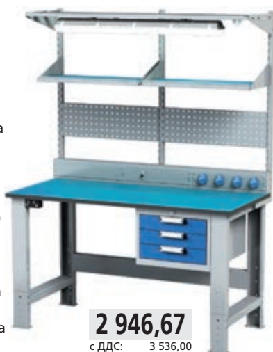
2 946,67 с ддс: 3 536,00

- Масата е оборудвана с регулируеми на височина крака с крепеж. ESD електростатичен работен плот със заземяващ кабел и ESD антистатична заземяваща кутия ESD PZBA, канал, надстройка с, EUROPERFO пълнеж, подвижни рафтове с дълбочина 200 мм, с ESD антистатични подложки и заземяващи кабели, осветителна рампа с осветително тяло P236 и окачващ се C-профил с количка на четири колела.