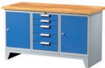
Тип: 7672 (ширина 1500 мм) 1 955,50 лв (без ДДС) / с ддс: 2 346,60