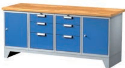
Тип: 7674 (ширина 2000 мм) 2 602,58 лв (без ДДС) / с ддс: 3 123,10