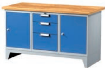
Тип: 7671 (ширина 1500 мм) 1 794,58 лв (без ДДС) / с ддс: 2 153,50