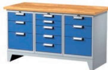
Тип: 7673 (ширина 1500 мм) 2 488,00 лв (без ДДС) / с ддс: 2 985,60