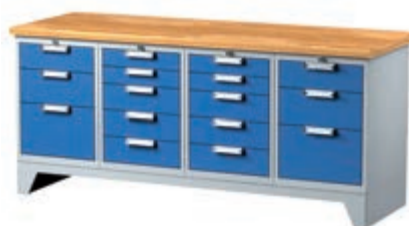
Тип: 7676 (ширина 2000 мм) 3 453,58 лв (без ДДС) / с ддс: 4 144,30