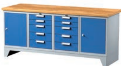
Тип: 7675 (ширина 2000 мм) 2 924,08 лв (без ДДС) / с ддс: 3 508,90