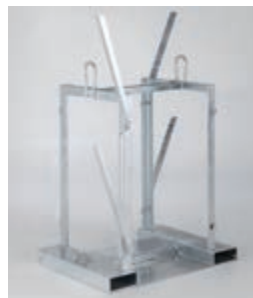
Лесно укрепване на бутилките.