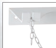
Детайл на веригата за захващане на бутилките.