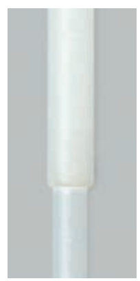
Детайл на телескопичната тръба.