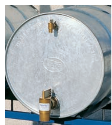
Детайл на крановете.