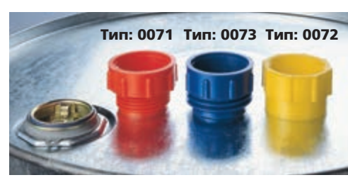
Тип: 0071 Тип: 0073 Тип: 0072