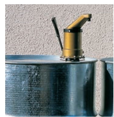
Ръчна помпа, прикрепена към варел.