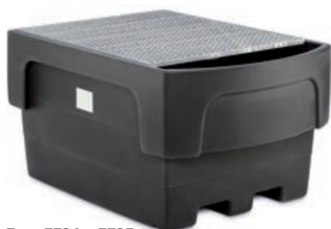
Тип: 7724 + 7725