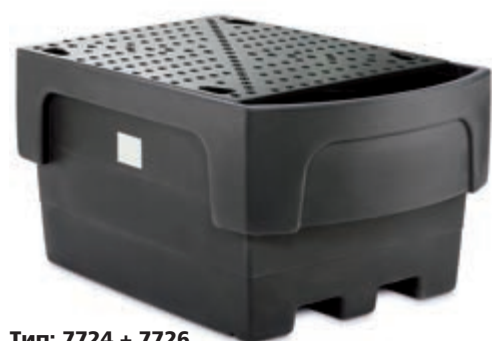
Тип: 7724 + 7726