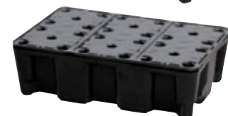
Тип: 7398 със скари