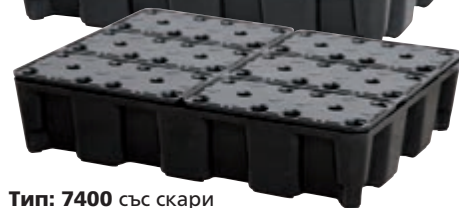
Тип: 7400 със скари