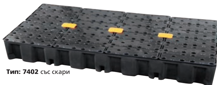
Тип: 7402 със скари