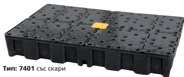
Тип: 7401 със скари