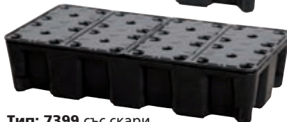
Тип: 7399 със скари