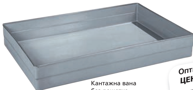
Кантажна вана без решетка. Тип: 4498