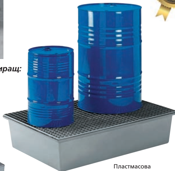
Пластмасова вана за 2 варела. Тип: 4237